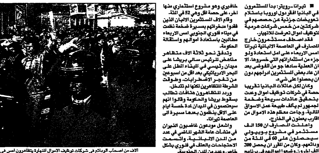
الات من اصحاب الريع في شركات توظيف الاموال المنهارة يتظاهرون امس في بلدة فلور الساحلية الجنوبية